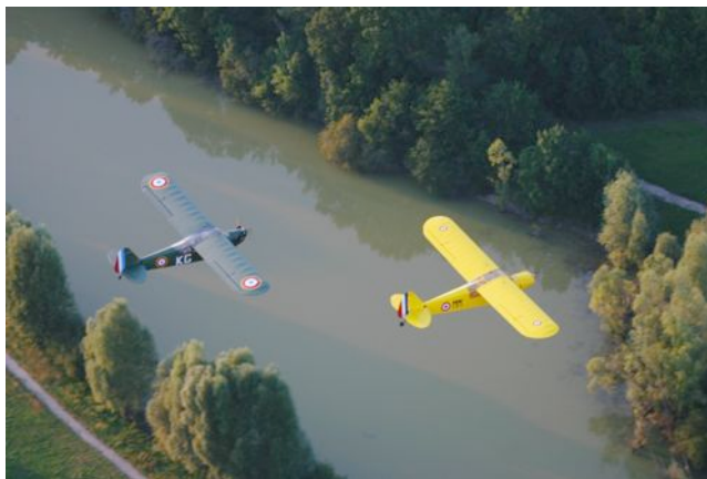
Vol en patrouille de deux Piper au dessus de l'Indre

Le montant de la cotisation 2006 est fixé à € 45.00