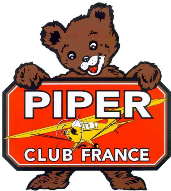
logo du Piper Club France - Ourson hilare

"Rassembler les propriétaires, pilotes et sympathisants des avions de type PIPER CUB à train classique et dérivés, ainsi que promouvoir et encourager leur restauration et leur maintien en état de vol."