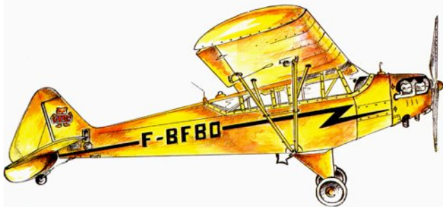
dessin du Piper J3 -F-BFBO basé à Lognes Emerainville

Association régie par la loi du 01 juillet 1901 Siège social: 9, rue Jules Vallés 77420 CHAMPS sur MARNE Site : http://www.piperclubfrance.org - Fax: 01 60 06 04 10