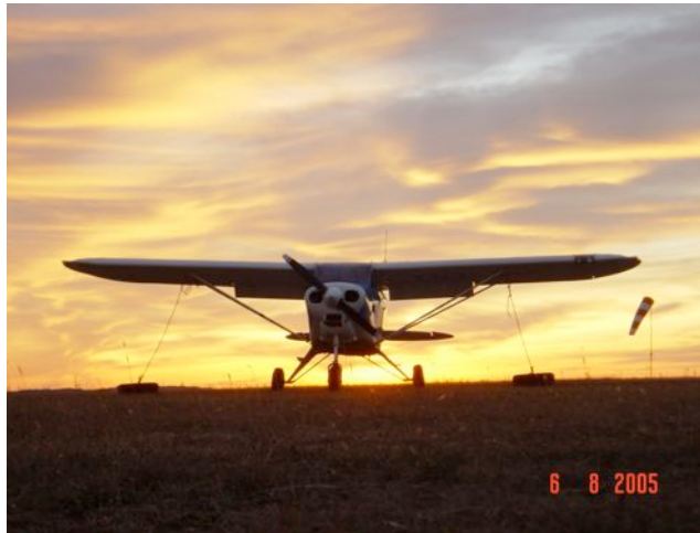
Coucher de soleil sur le terrain de Lacave et sur Piper