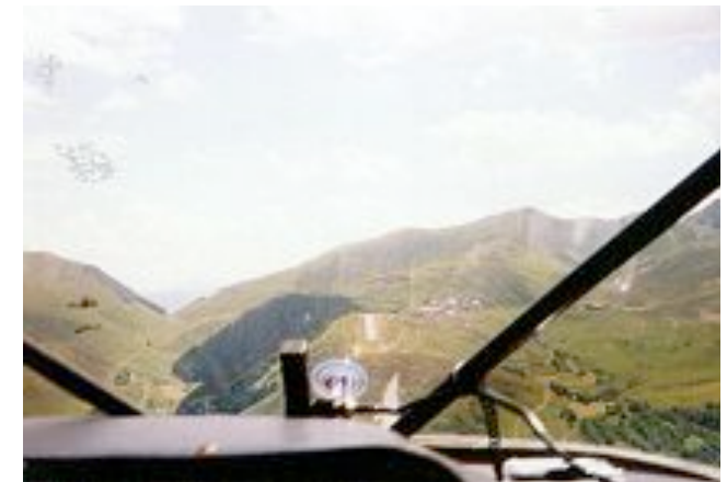
En courte finale – altiport de Peyresourde-Balestas (LFIP)

~ par l'organisation d'escapades (sorties ou regroupements spécifiques), sur des aérodromes intéressants (en 2005 : Amiens, Boulogne sur Mer Lacave - Rocamadour, Saumur) - 12-15.08.2006 Oloron Ste Marie - Dax - 09&10.09.2006 Saumur - Montsoreault.